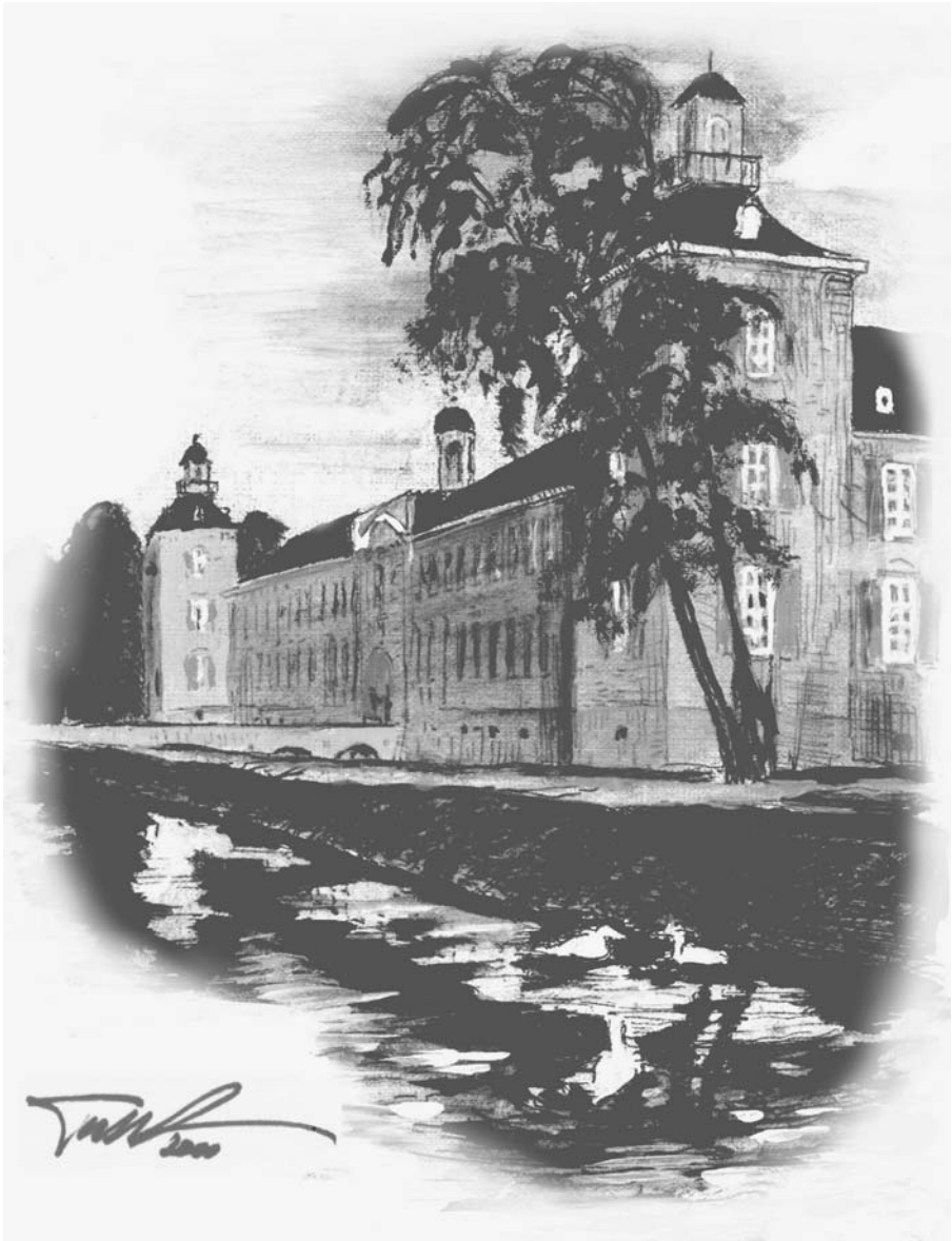
Schloss Kalkum (Westflügel) um 1990