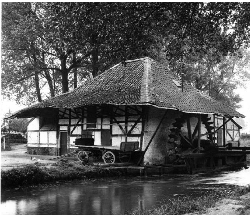
Die Kalkumer Mühle (12. Jahrhundert ?) um 1920

Im Jahre 1946 entschloss sich Fürstin Maria von Hatzfeldt das Schloss zu verkaufen, und bot es dem gerade neugebildeten Land Nordrhein-Westfalen zum Kauf an. Am 15.11.1946 wurde der Kaufvertrag mit einem vereinbarten Kaufpreis von 750.000,-RM abgeschlossen. Der Vertrag enthält einen Passus, dass der katholischen Pfarrgemeinde gestattet werden muss, einmal im Jahr, am Sonntag nach dem Kreuzfest, eine Prozession durch den Park abzuhalten und dabei einen Altar aufzurichten. Heute ist das Schloss im Besitz des Landes Nordrhein-Westfalen, welches hier eine Zweigstelle ihres Hauptstaatsarchivs unterhält.