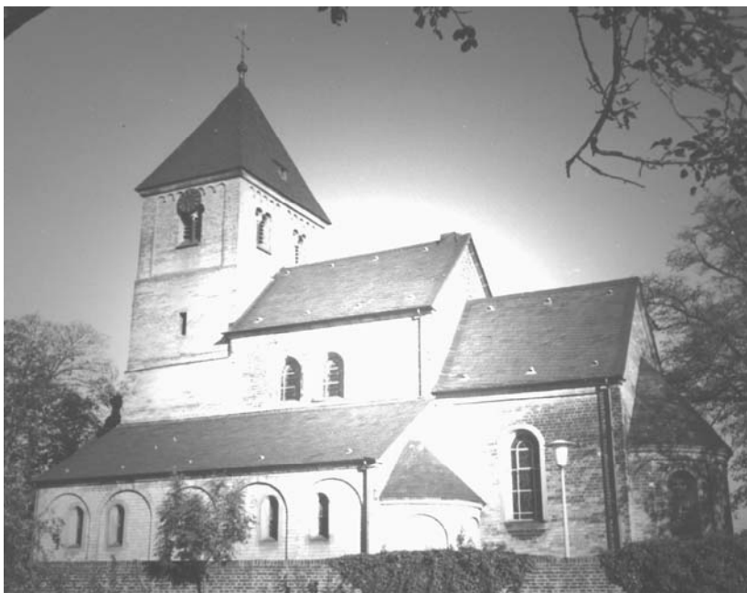
Die Pfarrkirche St. Lambertus Kalkum um 1970

Mit der Geschichte Kalkums ist die Pfarrkirche St. Lambertus untrennbar verbunden. Es ist anzunehmen, dass es in Kalkum bereits vor dem Bau der neuen Kirche, die (nach von Troisdorff) im Jahre 1171 in Stein errichtet wurde ein Gotteshaus gab. Ob dieses die Kirche war, die entsprechend der bei der Stiftung gemachten Auflage vom Stift Gandersheim errichtet werden sollte ist nicht bekannt. Um 1200 wird der Kirchturm um das dritte (Glocken-) Geschoss aufgestockt. Es wird angenommen, dass der Abschluss der Bauarbeiten an der neuen Kirche mit der Stiftung des neuen Hauptaltares im Jahre 1236 in Zusammenhang steht.